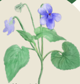
Kratviol ( Viola riviniana )

Her er almindelige planter, insekter og krybdyr i haven samlet på plakater, som du kan printe og hænge op.