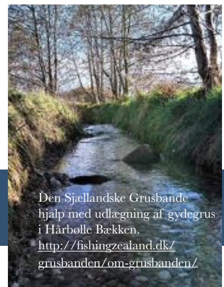
Den Sjællandske Grusbande hjalp med udlægning af gydegrus i Hårbølle Bækken. http://fishingzealand.dk/grusbanden/om-grusbanden/