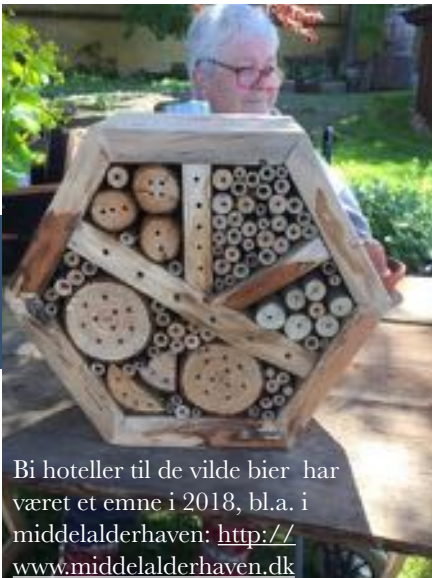
Bi hoteller til de vilde bier har været et emne i 2018, bl.a. i middelalderhaven: http://www.middelalderhaven.dk

I 2017 har biosfære sekretariatet samarbejdet med en række foreninger og frivillige om bl.a. 'Udflugterne i Møn Biosfæreområde' og forskellige events og formidlingsaktiviteter.