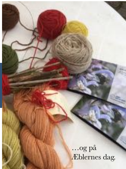
...og på Æblernes dag.