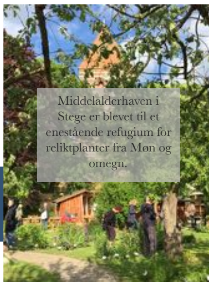
Middelalderhaven i Stege er blevet til et enestående refugium for reliktpanter fra Møn og omegn.