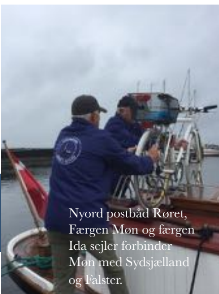
Nyord postbåd Røret, Færgen Møn og færgen Ida sejler forbinder Møn med Sydsjælland og Falster.